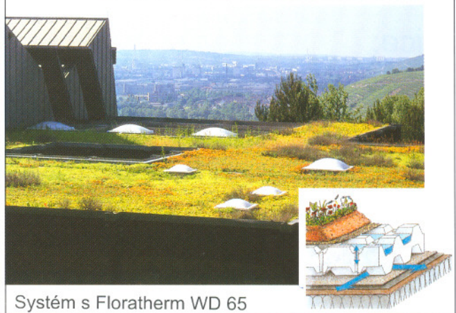
Systém s Floratherm WD 65