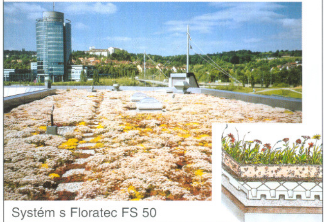
Systém s Floratec FS 50