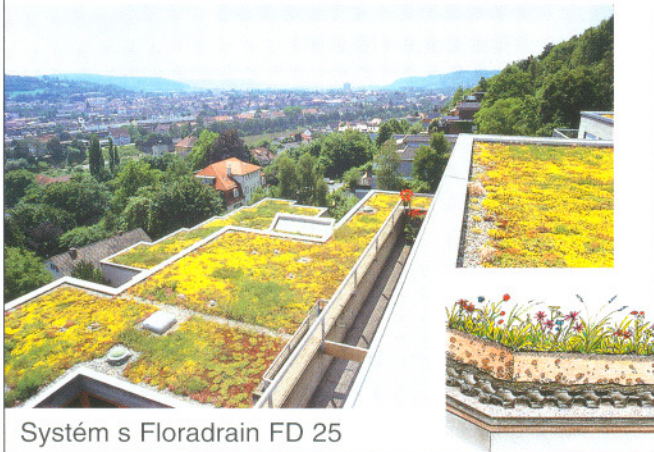
Systém s Floradrain FD 25